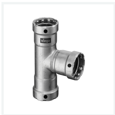
Megapress-T-Stück mit SC-Contur Modell 4218 Artikel 695 019