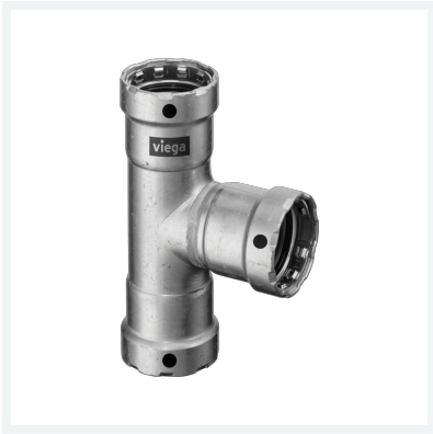
Megapress-T-Stück mit SC-Contur Modell 4218 Artikel 695 071