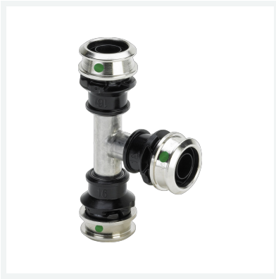
Raxinox-T-Stück mit SC-Contur - Pressanschlüsse Modell 4418