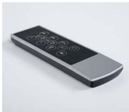
i Fernbedienung Télécommande Afstandsbediening