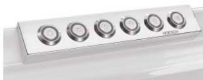
i Einfache Steuerung per Bedienpaneel Commande facile à l'aide du panneau de commande Eenvoudige besturing met bedieningspaneel