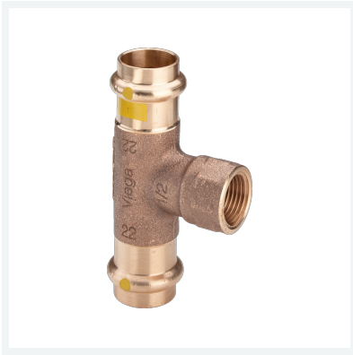
Profipress G-T-Stück mit SC-Contur Modell 2617.2 Artikel 352 707