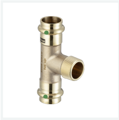
Sanpress-T-Stück mit SC-Contur Modell 2217.1 Artikel 197 858