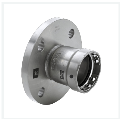
Megapress-Flanschübergang mit SC-Contur Modell 4259 Artikel 694 876