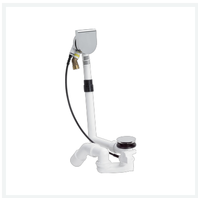
Multiplex Trio-Ab-/Überlauf Visign MT9 Wasserstandsanhhebung plus 5 cm Modell 6170.10 Artikel 724 559