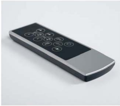
i Fernbedienung Télécommande Afstandsbediening