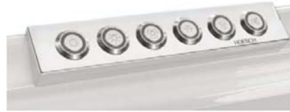
i Einfache Steuerung per Bedienpaneel Commande facile à l'aide du panneau de commande Eenvoudige besturing met bedieningspaneel