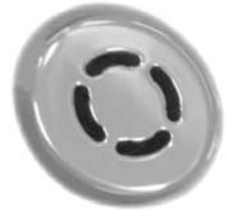
i Rückendüsen Buses de massage dorsales Rückendüsen