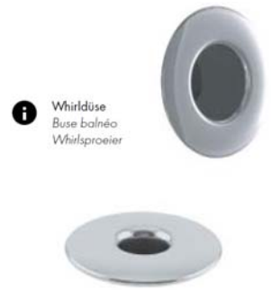
i Whirldüse Buse balnéo Whirlsproeier