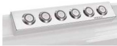
i Einfache Steuerung per Bedienpaneel Commande facile à l'aide du panneau de commande Eenvoudige besturing met bedieningspaneel