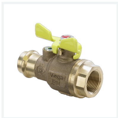
Profipress G-Gaskugelhahn mit SC-Contur Modell 2671.3 Artikel 587 468