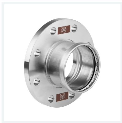
Temponox XL-Flanschübergang mit SC-Contur Modell 1759XL Artikel 811 198