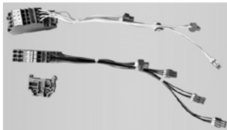
Abb. 1 Lieferumfang