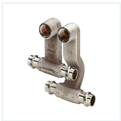
Sanpress-Heizkörperanschlussstück mit SC-Contur Modell 2273.1 Artikel 446 628