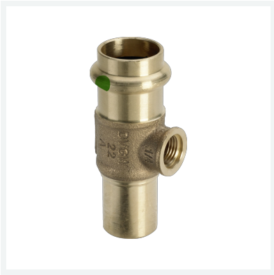
Sanpress-T-Stück G \frac{1}{4} , mit Einsteckende mit SC-Contur Modell 2217.4 Artikel 705 596