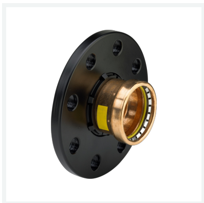
Profipress G XL-Flanschübergang mit SC-Contur Modell 2659.5XL Artikel 577 971