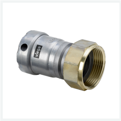
Megapress-Anschlussverschraubung mit SC-Contur Modell 4263 Artikel 718 862