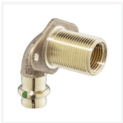
Sanpress-Wanddurchführung mit SC-Contur Modell 2232.1 Artikel 279 301