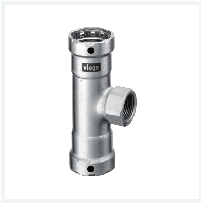
Megapress-T-Stück mit SC-Contur Modell 4217.2 Artikel 755 959