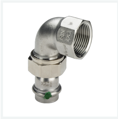
Sanpress Inox-Übergangverschraubung 90° mit SC-Contur Modell 2355 Artikel 437 343