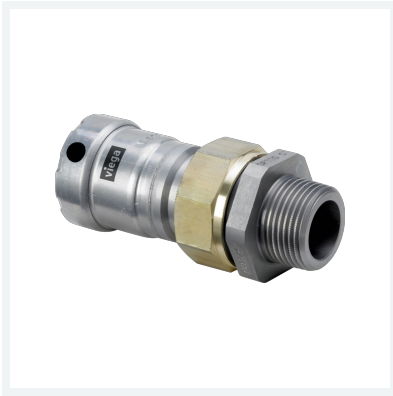
Megapress-Übergangverschraubung mit SC-Contur Modell 4265 Artikel 718 909