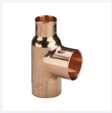
T-Stück - Lötanschlüsse Modell 95130