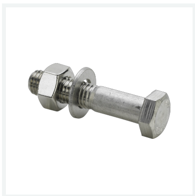
Sanpress Inox-Montageset Modell 2359.7 Artikel 611 262