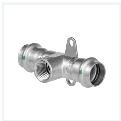
Sanpress Inox-Wandscheiben-T-Stück mit SC-Contur Modell 2317.3 Artikel 744 090