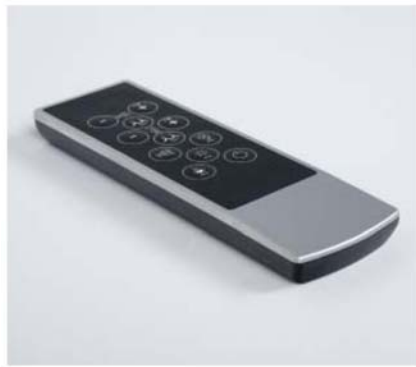
i Fernbedienung Télécommande Afstandsbediening