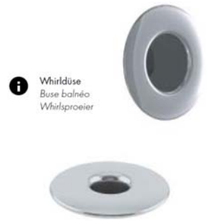
i Whirldüse Buse balnéo Whirlsproeier