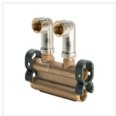
Sockelleisten-Heizkörperanschlussstück Modell 2277.2 Artikel 662 509