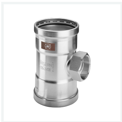
Temponox XL-T-Stück mit SC-Contur Modell 1717.2XL Artikel 810 962