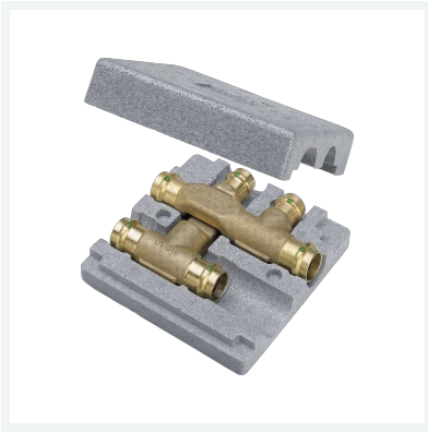
Sanpress-Kreuzungs-T-Stück mit SC-Contur Modell 2249.3 Artikel 493 356