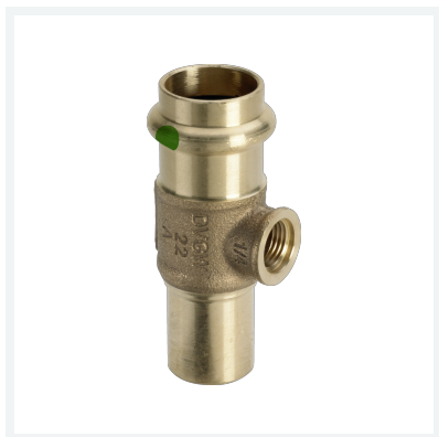
Sanpress-T-Stück G \frac{1}{4} , mit Einsteckende mit SC-Contur Modell 2217.4 Artikel 705 619