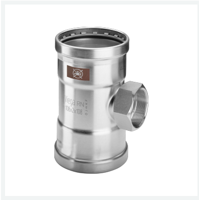
Temponox XL-T-Stück mit SC-Contur Modell 1717.2XL Artikel 810 979